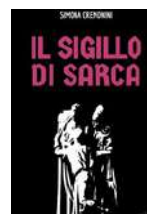
tavola ouija: ma, anziché comunicare con il fantasma della regina medievale Adelaide di Borgogna , risveglieranno divinità antiche e misteriose , delle quali ormai si narra solo nelle leggende locali .

Nell'estate del 1991 a Manerba del Garda cinque ragazzine organizzano una seduta spiritica con una vecchia